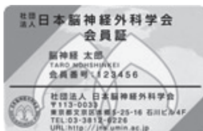
(A) 一般社団法人日本脳神経外科学会会員証

「一般社団法人日本脳神経外科学会会員証」を用いて、参加費のお支払い・専門医クレジットのご登録が出来ます。（一般社団法人日本脳神経外科学会会員のみ）