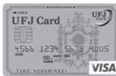
(B) 会員 UFJ クレジットカード（持参は不要）

受付には (A) のみをご持参下さい。(B) UFJ会員クレジットカードの持参は不要です。